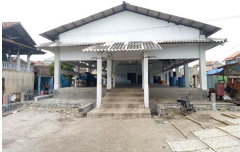
Gambar 3. TPI Bandengan

Kecamatan Bandengan, Kabupaten Kendal. serta berada pada sisi sungai kendal dengan luas bangunan TPI 1,152 meter.