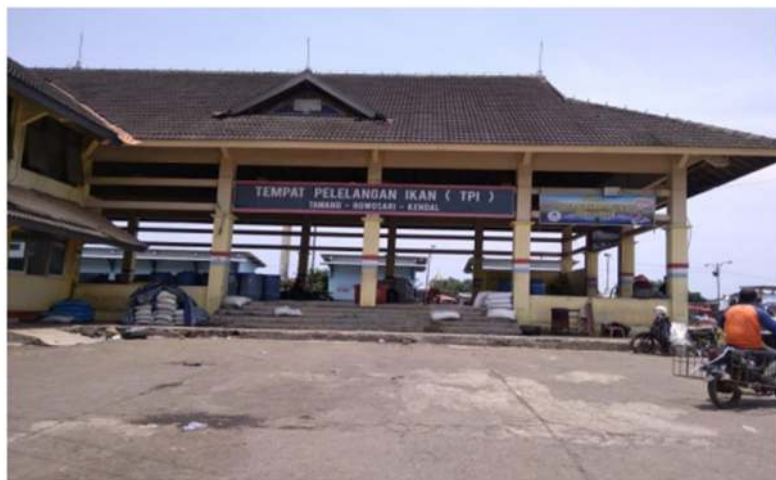
Gambar 2. TPI Tawang

TPI Tawang merupakan TPI yang terbesar di Kabupaten Kendal, dikarenakan termasuk dalam bagian dari fasilitas fungsional Pelabuhan Perikanan Pantai (PPP) dan PPP Tawang merupakan UPT Dinas Kelautan dan Perikanan Provinsi Jawa Tengah. Sedangkan TPI Tawang dikelola oleh Koperasi Unit Desa (KUD) Mina Jaya yang berada di bawah naungan Dinas Kelautan dan Perikanan Kabupaten Kendal. TPI Tawang terletak pada titik 60 55'0,3" LS dan 110 02' 49,7" BT di Desa Gempolsewu Kecamatan Rowosari Kabupaten Kendal serta berada dialiran sungai kali Kuto.