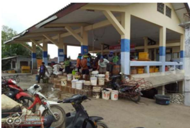
Gambar 6. Tanggul Malang

TPI Tanggul Malang terletak di desa Korowelang kulon, Kecamatan Cepiring, Kabupaten Kendal dengan titik koordinat 60° 53' 54" LS dan 110° 10' 36" LS, kegiatan lelang pada TPI di mulai pukul 14.00 wib- selesai. Adapun jenis ikan yang sering dilelang adalah teri, bawal, layur, cumi-cumi, kembung, empar, tengiri, tongkol, dan cakalang. Jumlah kapal yang berpangkalan di TPI Tanggul Malang 247 Unit motor temple, sedangkan untuk alat tangkap yang sering digunakan nelayan yaitu: gill net, jaring, dogol, dan apolo.