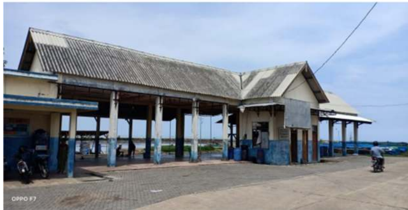
Gambar 5. TPI Karangsari

TPI Sendang Sikucing dikelola oleh KUD “Mina Jaya” dalam naungan Dinas Kelautan dan Perikanan Kab. Kendal. Jarak TPI dari jalan raya sekitar 3 km. Jumlah kapal yang berpangkalan di TPI Sendang Sikucing 98 Unit motor tempel. Produksi pada tahun sebelumnya sebesar 842.563 Kg senilai Rp. 5.920.405.000,-. Jenis alat tangkap yang biasa digunakan adalah: Arat, Moler, Bubu, Cantrang, Pukat Cincin, Jaring Insang, Jaring Udang, dan Pancing. Serta didominasi dengan alat tangkap payang dengan komoditas tangkap ikan teri, Sedangkan permasalahan yang dihadapi saat ini adalah pendangkalan kolam Dermaga.