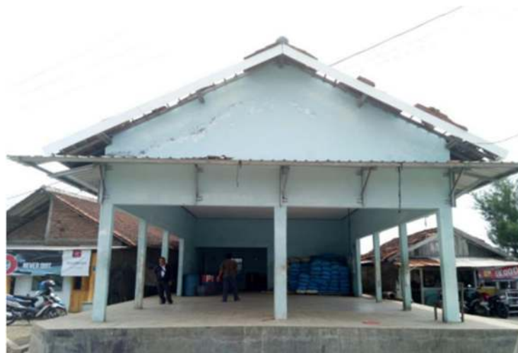
Gambar 4. TPI Karang Sari

TPI Karang Sari berada di Desa Karang Sari, Kecamatan Kendal. TPI Karang Sari dikelola oleh KUD “Mina Jaya”. Jarak TPI dari jalan raya sekitar 0 km. Jumlah kapal yang berpangkalan di TPI Karang Sari 23 Unit motor tempel. Produksi tahun 2017 sebesar 481.971 Kg senilai Rp. 3.867.711.000,-. Jenis alat tangkap yang biasa digunakan adalah: Moler, Bubu, Arat, Jaring Insang, Pukat Cincin, Pancing. Sedangkan permasalahan yang terjadi adalah pendangkalan alur kapal, bangunan TPI terendam air Rob.